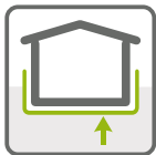
HYDROIZOLACE SPODNÍ STAVBY

HYDROIZOLAČNÍ PÁS Z SBS MODIFIKOVANÉHO ASFALTU S VLOŽKOU Z HLINÍKOVÉ FÓLIE A SKELNÉ ROHOŽE S POVRCHOVOU ÚPRAVOU MINERÁLNÍM JEMNOZRNNÝM POSYPEM